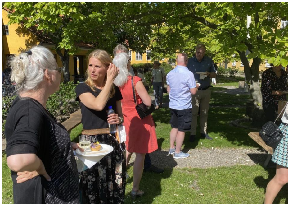
Efter den formelle del af generalforsamlingen var der kage, bobler, Ukrudt-brus fra FRAK og gode snakke i gårdhaven.