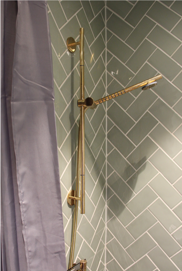
Hotellet har et lille bad/toilet, der er udsmykket med grønne klinker og messing som i køkkenet.