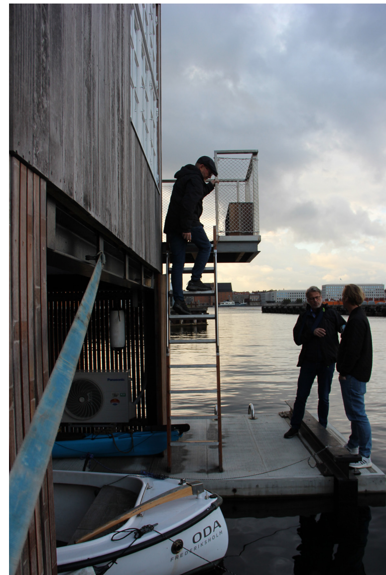
Hotellets "garage" er udstyret med kajak og en båd, der står til fri afbenyttelse.