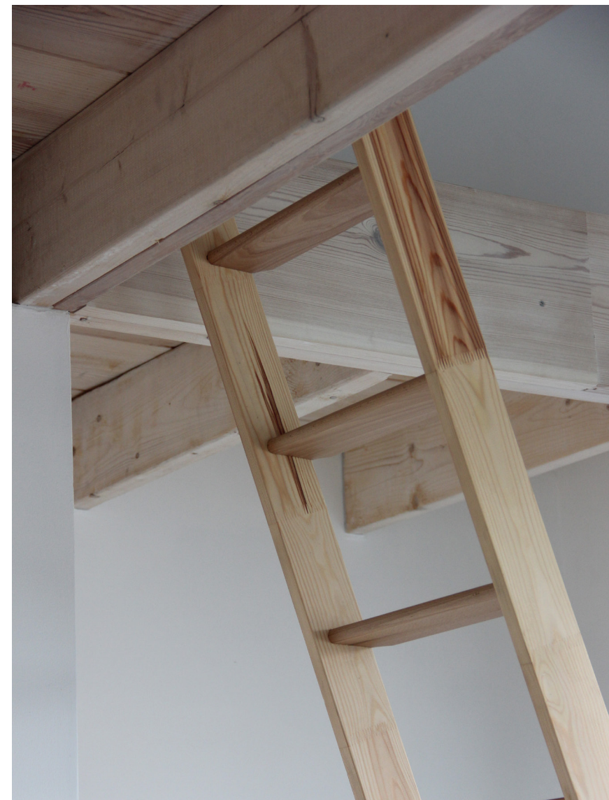
Trappen fører op til en hems, hvor der står to senge. Dermed kan man bo der med en familie på 4.