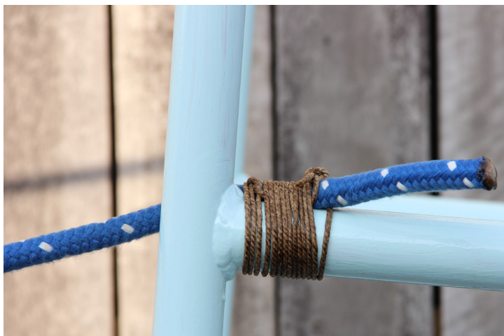
Den lyseblå farve er flot til vandet og er den samme som på badeanstalten Helgoland.