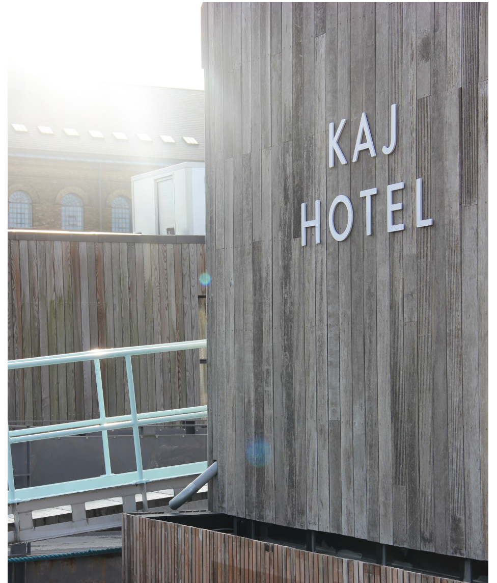
Facadebeklædningen består af gamle terrassebrædder og er, som mange af bygningens øvrige dele, genbrug.