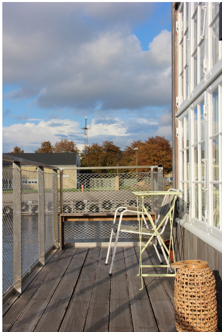
På den lille terrasse foran hotellet kommer man helt i kontakt med vandet og solnedgangen.