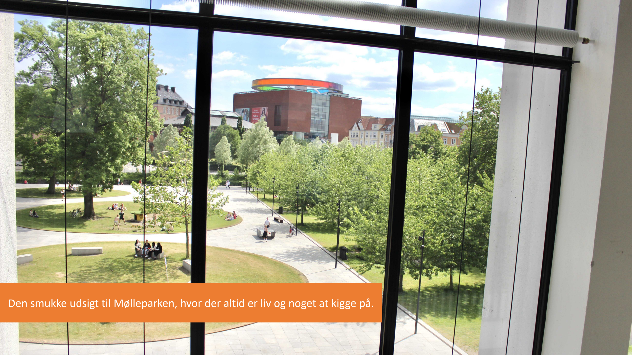
Den smukke udsigt til Mølleparken, hvor der altid er liv og noget at kigge på.