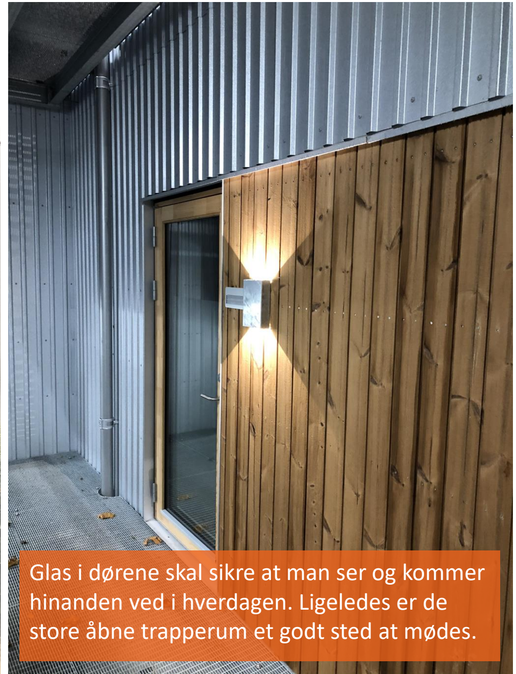
Glas i dørene skal sikre at man ser og kommer hinanden ved i hverdagen. Ligeledes er de store åbne trapperum et godt sted at mødes.