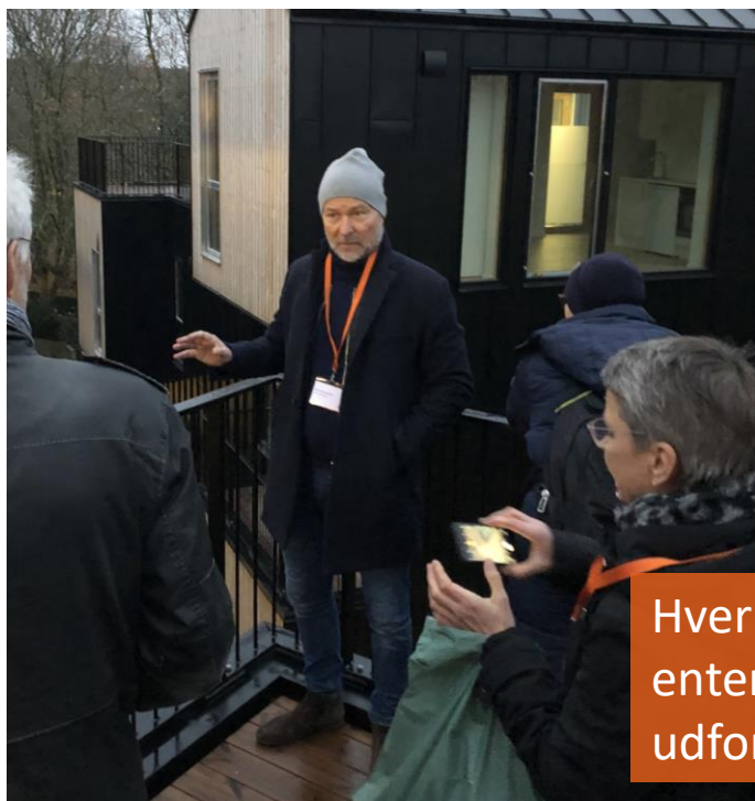
Hver etage består af 3 kuber/deleboliger til hver 2 personer – enten 2 studerende eller 2 flygtninge. Boligerne er bevidst udformet så man passerer og kommer hinanden ved i hverdagen.