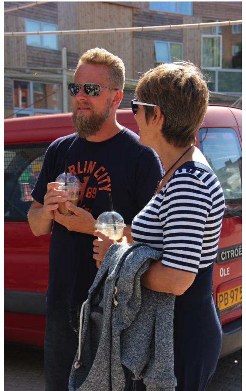
Vi sluttede dagen af med iskaffe til at blive kølet af på den varme dag.