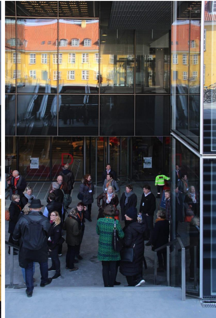
En blæsende introduktion mellem BLOX's blå glaspartier og Fæstningens Materialgårds gule facade.