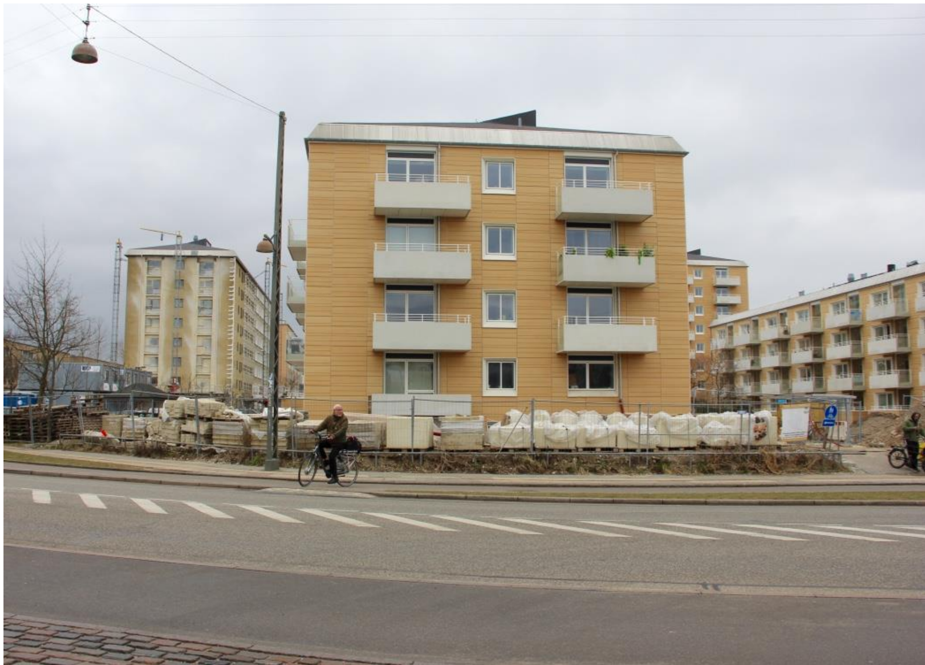
Et vue fra Sjælør St. Facadepåklædningen i forskellige stadier.