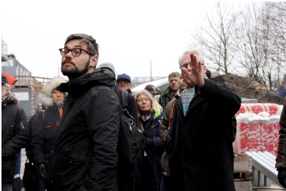
Scener fra byggepladsen.