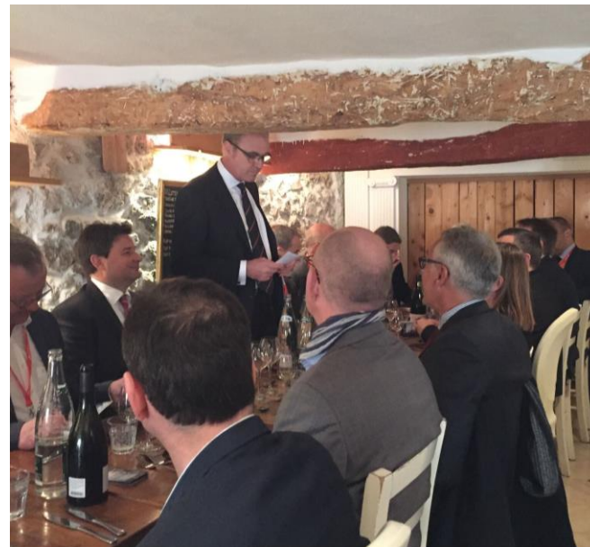
Frokost med Sweco