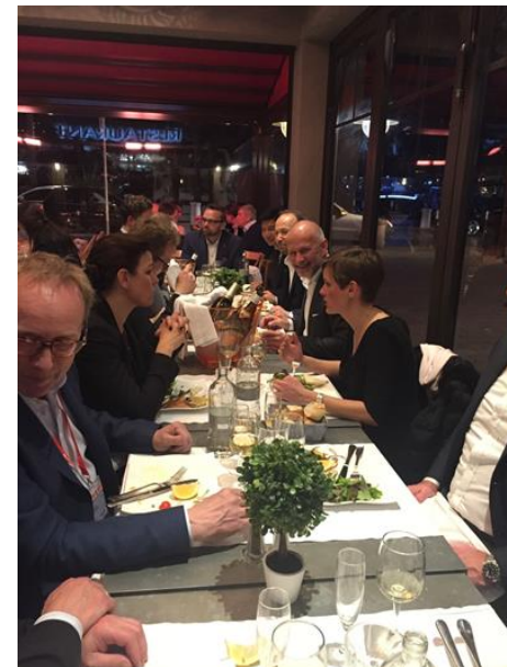
Middag med Pind & Partnere