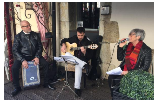
Fransk stemning med musik hos Sweco