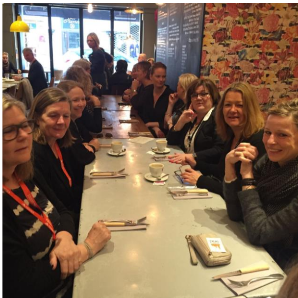
"Kvinder i ejendomsmarkedet"

Ud over vores egne arrangementer og en række spontane kaffemøder, frokoster og middage var jeg inviteret til frokost med Lett Advokater, Pind og Partnere, Sweco i Mougins, beach-party hos Orbicon og Nordic Lounge med Estate Media mfl. Det blev også til en brunch-aftale med kvindenetværket "Kvinder i Ejendomsmarkedet". Tak for invitationerne. Til næste år vil jeg forsøge at nå endnu flere invitationer.