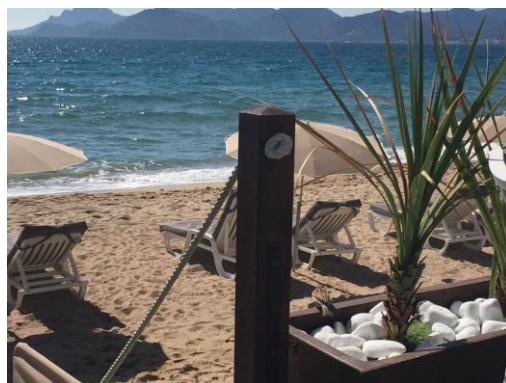
Beach Party hos Orbicon