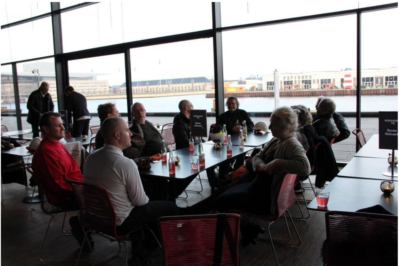
En rigtig spændende eftermiddag afslutter vi med networking i Skuespilhusets café.