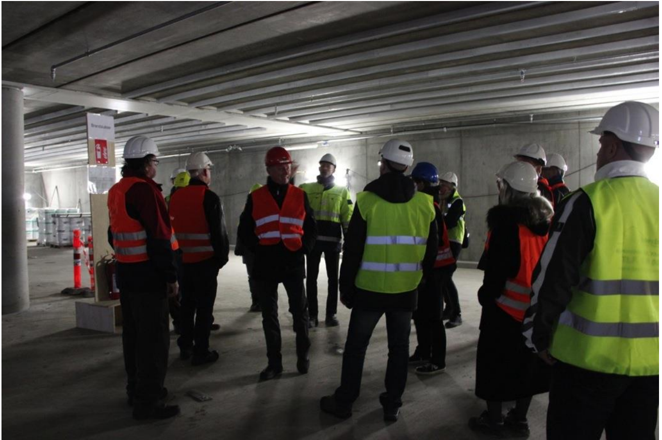
Det nye tre etagers parkeringsanlæg med 500 parkeringspladser der er etableret under Kvæsthusmolen.