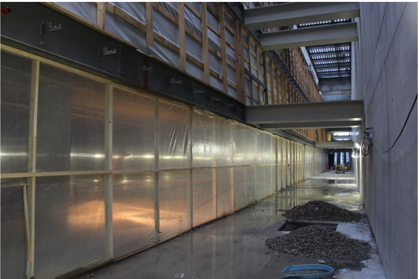
I det store forbindelsesrum, som strækker sig i hele anlæggets længde, vil der blive arbejdet med kunstnerisk belysning og der vil være mulighed for at afholde kulturelle arrangementer.