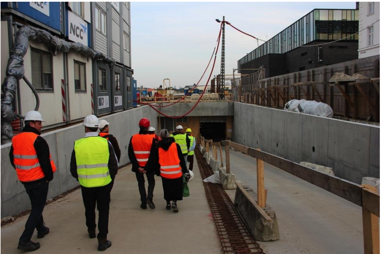
Parkeringspladserne på Sankt Anne Plads nedlægges og i stedet etableres 250 cykelparkeringspladser. Derudover bliver trærækken på Sankt Annæ Plads forlænget hen til Kvæsthusmolen.