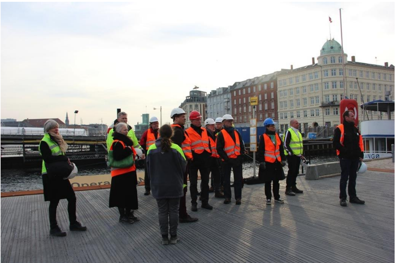
Kvæsthuspladsen, der strækker sig fra Nyhavn til molespidsen, belægges med mørkt rått rillet beton, som skal spille op imod Skuespilhusets mørke facade.