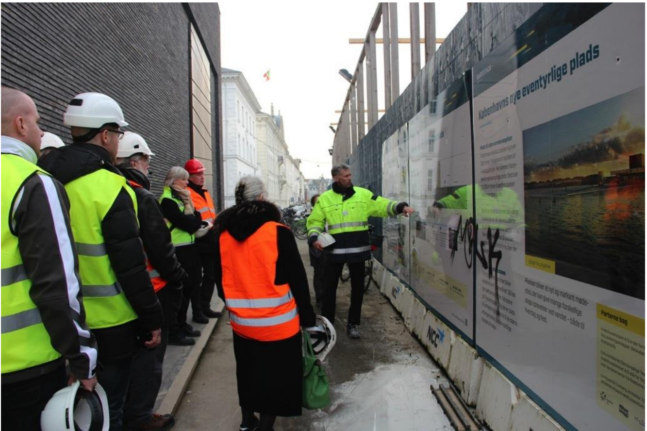
I forbindelse med Sankt Annæ projektet skybrudssikres Sankt Annæ Plads, så området i mellem træerne på pladsen forsænkes og der lægges underjordiske rør, som skal lede regnvandet ud i havnen.