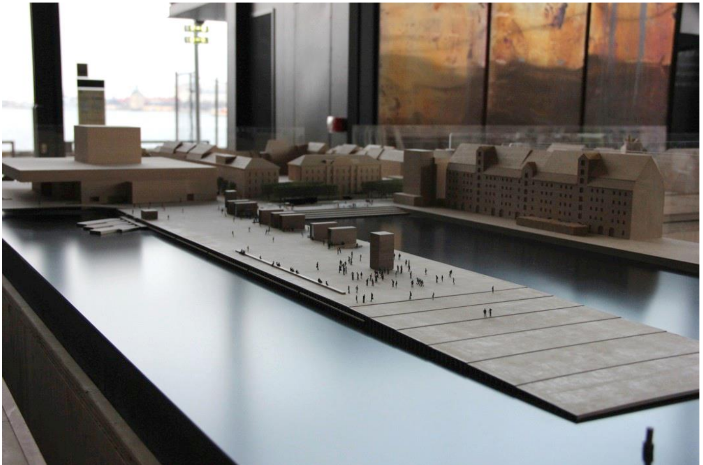
Model af Kvæsthusprojektet – her ses Kvæsthusemolen som er 250 meter lang og 50 meter bred.

Byens Netværk besøger Kvæsthusprojektet, hvor vi får en rundvisning og hører om Kvæsthusprojektet og Sankt Annæ Projektet, som skal blive til et nyt mangfoldigt byrum og hvordan der klimatilpasses ift. skybrud.