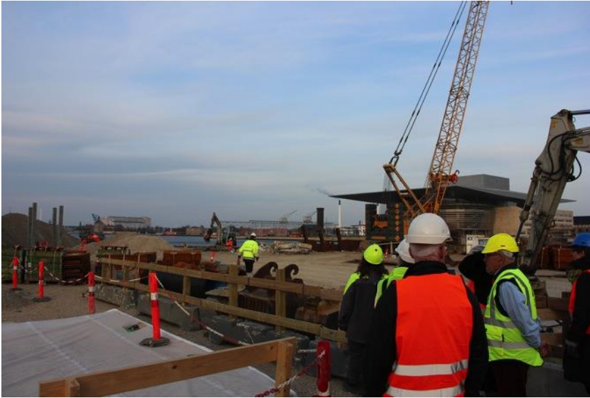
Byggepladsen på Kvæsthusemolen