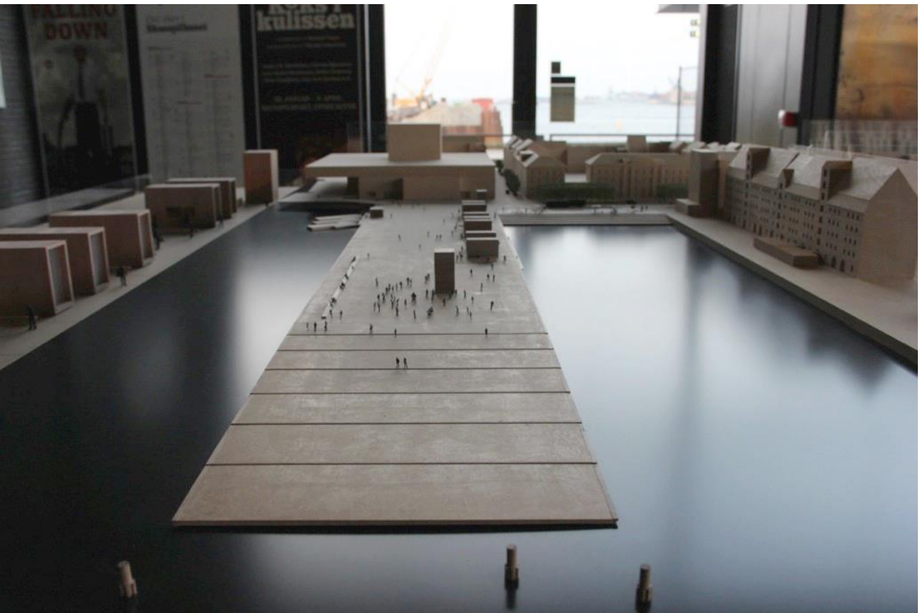
I Kvæsthusbassinet og på ydersiden af molen vil det være muligt for mindre både og store sejskibe at ligge til kaj. For enden af Kvæsthusbassinet (til højre for molen) etableres Kyssetrappen, som er en 65 meter bred trappe i træ der går lige ned til Kvæsthusbassinet.