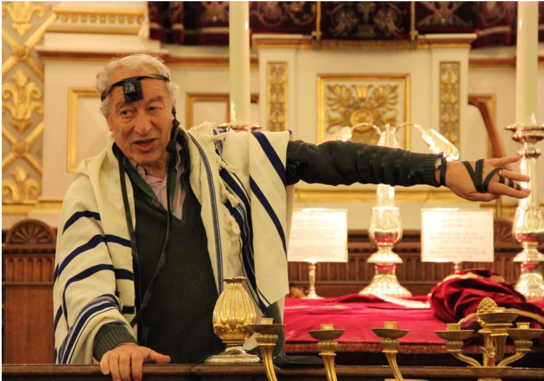
Demonstration af bederitualet.