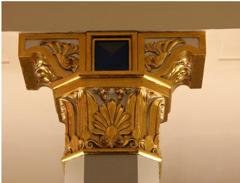
Detaljer fra synagogens udsmykning.