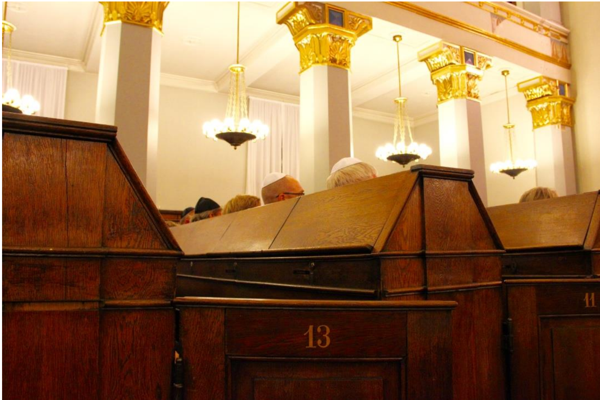
Kalotter på række Synagogen.